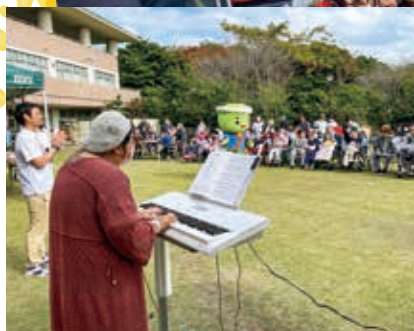
音楽クラブでの練習の成果を 秋空の下で♪