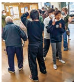
曲が流れると みんな踊り出します♪