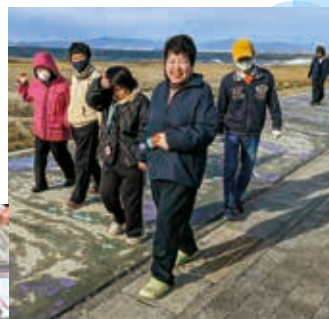
▲ウォーキングクラブ