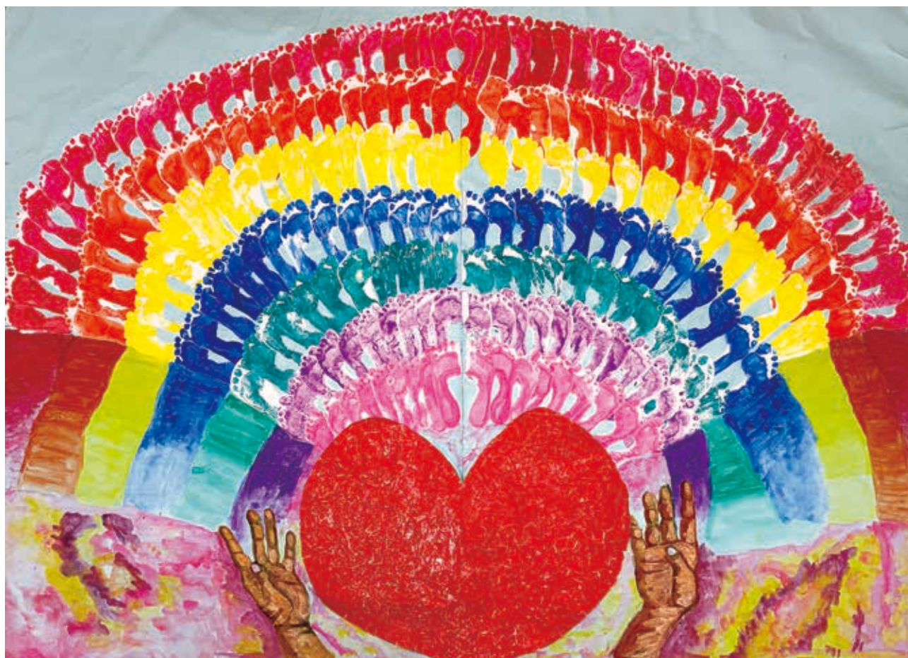
つながる一步 広がる笑顔（蔵王の杜）