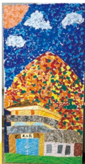
蔵王苑周辺の風景を 貼り絵で(共同作品)