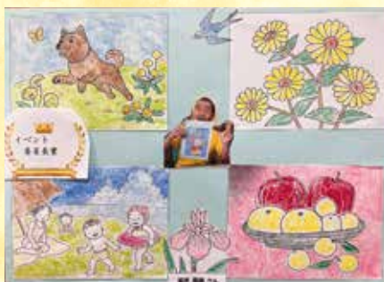
イベント委員長賞